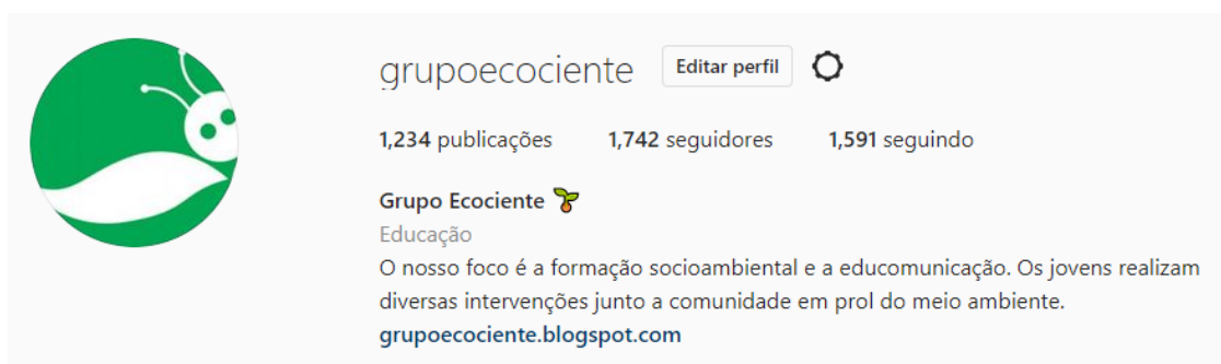
(Nosso perfil no Instagram)